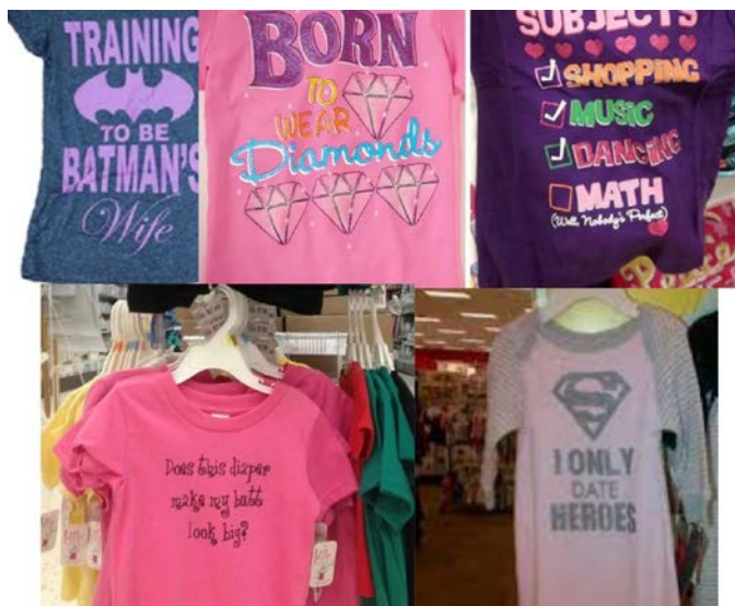
Одежда, представленная в отделах одежды для девочек.

Далее в статье будет рассмотрены наиболее наглядные ситуации, которые выступят подтверждением тезиса о разрушительности мизогинного мышления.